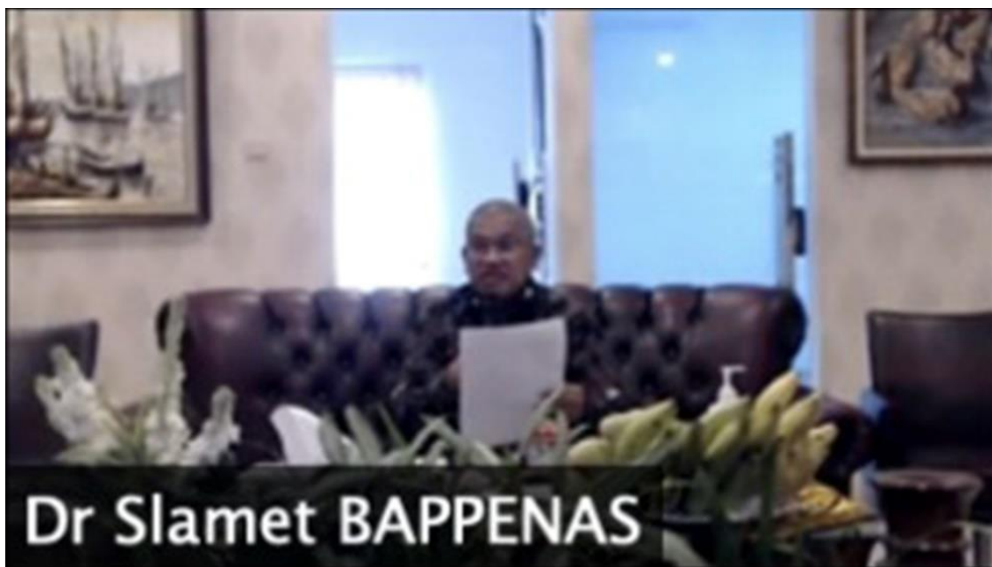
Slamet Soedarsono 博士，印尼国家发展计划部副部长

Slamet Soedarsono 博士是印尼国家发展计划部主管政治、法律、国防和安全的副部长，他希望项目参与者可以从新加坡过去五十年的发展历程中汲取经验，新加坡是如何转变成世界上最宜居的城市以及人力资本排名最高的国家。他认为印尼可以借鉴这些经验。同时他也希望项目可以碰撞出火花，激发思考，鼓励参与者对印尼公共治理展开有益的讨论。Slatmet 博士代表合作方感谢学院和淡马锡基金会对项目的周到安排，也感谢来自不同机构的参与者的积极参与。