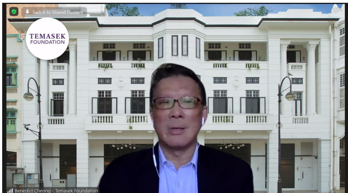
淡马锡国际基金会总裁钟添明先生

淡马锡国际基金会总裁钟添明先生简略介绍了淡马锡基金会旗下项目，这些项目旨在促进亚洲及其他地区领导人和社区间人与人的交流和知识交换。他分享了基金会与学院在为领导人搭建交流思想和知识平台中所作出的努力。钟总裁表示非常同意刘院长和 Slamet 博士的观点，这个项目不仅是一个研修项目，而且是相互学习和交流思想的机会。他认为印尼不可能照搬新加坡经验，新加坡只是一个小国，所面临的问题远没有印尼那么复杂。新加坡也有很多地方需要向印尼学习。他希望项目期间双方建立的友谊和联系将长期存在，印尼也可以从新加坡的经验中受益。最后，钟总裁也感谢了项目的合作伙伴以及所有参与者。